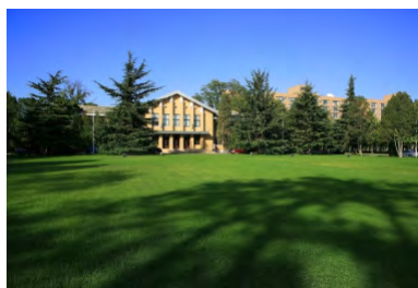
图6 中国科学院大学玉泉路校园全景

结合，建立以需求建基地、以基地办教育、以教育育人才、以人才促发展的科教融合新机制，培养尖端科技人才，成为未来工程科学家和工程技术领军人才的摇篮。我们深信，在未来通过弘扬钱学森先生工程科学思想，创新复合型人才培养模式，创建世界一流工程科学学院，将为国家输送优秀的工程科学领军和骨干人才，为国家现代化建设做出贡献。