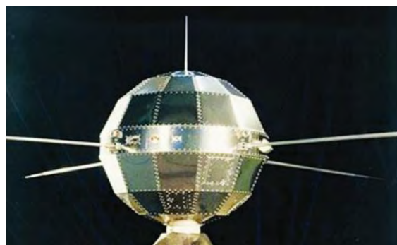
图4 我国1970年4月24日成功发射的第一颗人造卫星

从中国航天工程看，1956年，钱学森起草《建立我国国防航空工业意见书》；1958年，科学院实施581计划，第二年力学所开始火箭推进、高速空气动力学、高温结构前沿研究；1965年，成立651设计院，1970年4月24日发射第一颗人造卫星（图4）；1975年，第一颗返回式卫星；1984年，第一颗同步卫星；2005年，神舟五号载人飞行；2011~2013年，发射天宫一号与神舟八、九、十号，实现交会对接；直到2016年的天宫二号于最近顺利返回。嫦娥工程也顺利进行，实现了绕、落、回的目标，先后大约也经历了60年左右的时间。现在的中国科学院大学雁栖湖校区，即当年的矿冶学校，实际上就是中国科学院的火箭试验基地，现在是中国科学院与“两弹一星”纪念馆馆址（图5）。当年中国科学院集中力量科技攻关，解决了其中的若干关键科学技术问题：其一，研制了