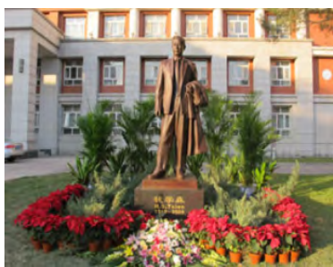
图3 在中国科学院力学研究所主楼前的钱学森纪念铜像

为什么钱学森先生会提出工程科学思想，从他的经历中可以略见一斑（图3）。在美国，他亲自经历火箭的研制，参加了美国航空航天计划“迈向新高度”（Towards new horizon）的规划和撰写。特别是在突破“声障”以后，人们意识到人类不久便能飞出大气层，所以，航天工程师将面临科学技术的新挑战。为了实现飞上太空的梦想，人类的知识不能局限于力学学科的范畴，必须要考虑高温气体的输运特性、自动控制等问题。1950~1955年钱学森先生在被美国移民局软禁期间撰写了《物理力学》与《工程控制论》两部工程科学的代表作，预见了新兴学科的重要性。所以，工程科学是应用力学的进一步拓展，强调学科交叉研究，适用于众多的科学和技术领域，符合现代科学技术发展的趋势。