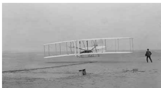
图2 1903年, 莱特兄弟成功研制了飞机, 实现了人类第一次动力飞行

哥参观世界博览会, 看到美国科技创新欣欣向荣, 正在赶超德国。克莱因认为, 哥廷根大学不能仅仅搞基础理论, 他倡导基础科学同工程的结合, 从而使自然科学成果尽快应用到工程技术中。于是, 他建立了三个应用科学系: 一个是希尔伯特的应用数学系, 一个是索莫菲尔特技术物理系, 还有一个就是应用力学系。他聘请普朗特担任应用力学系主任, 随后该系涌现了一批应用力学人才, 包括冯·诺依曼、柯朗、诺特、铁木辛柯等, 极大地推动了应用力学的飞速发展。