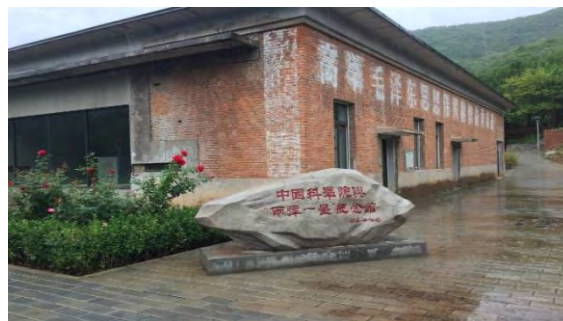
图5 在中国科学院大学雁栖湖校区的中国科学院与“两弹一星”纪念馆